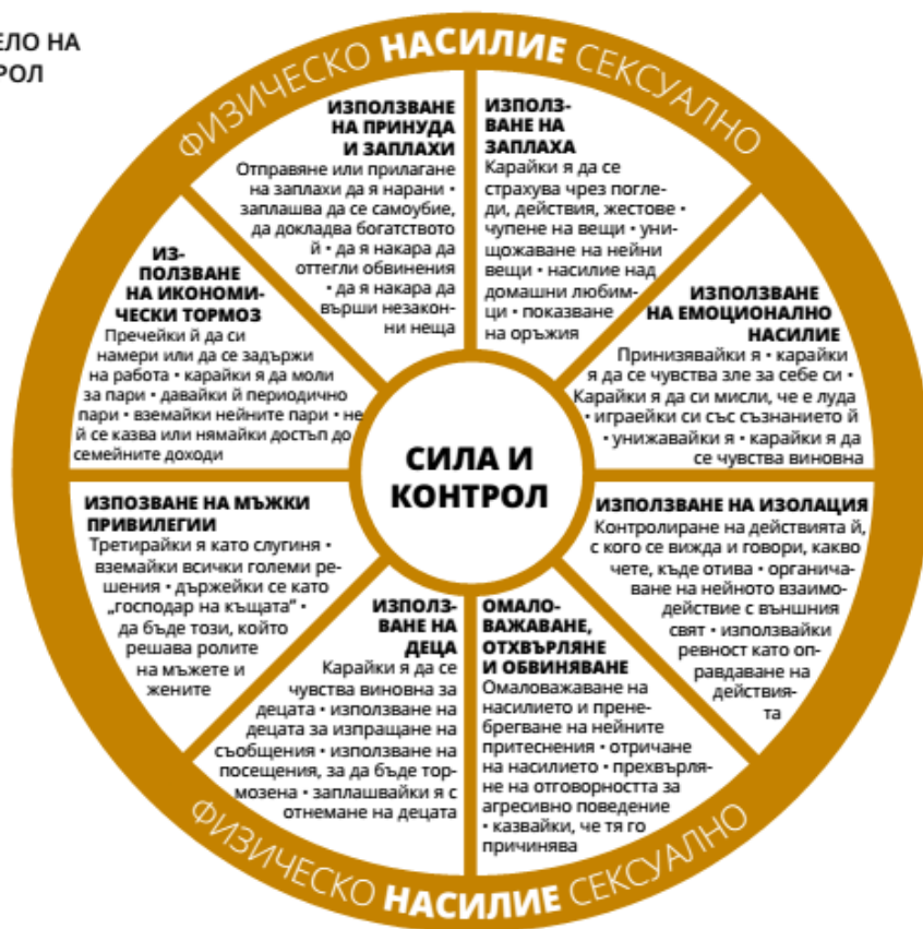
Фигура 1: КОЛЕЛО НА ВЛАСТ И КОНТРОЛ

Източник: Подобряване на ефективността на правоприлагането в борбата с насилието над жени и домашното насилие Наръчник за обучение на учител, Анна Костанза Болдри