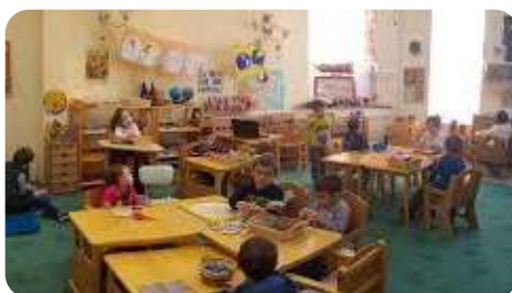
Заедно в детската градина